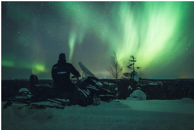
Bild 5: Aurora Powertrains stammt aus Lappland und ist der weltweit erste Anbieter von geführten Touren mit elektrischen Schneemobilen. Die Reichweite des eSled beträgt bis zu 100 Kilometer. © Aurora Powertrains.