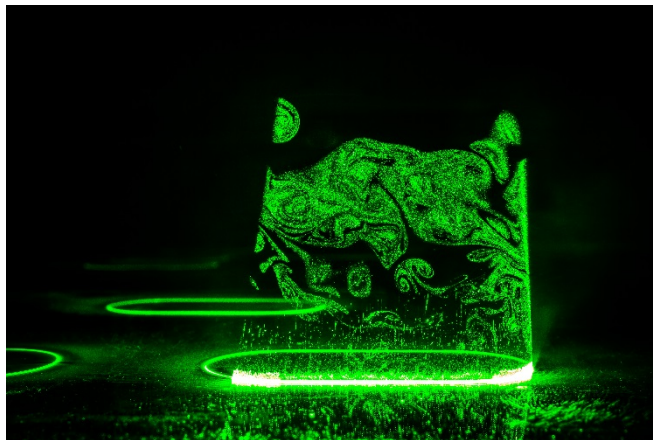
Bild 2: Strukturierungsprozess von Glas durch direkte Laserablation mit ultrakurz gepulster Laserstrahlung.

Die Fraunhofer-Gesellschaft ist die führende Organisation für angewandte Forschung in Europa. Unter ihrem Dach arbeiten 69 Institute und Forschungseinrichtungen an Standorten in ganz Deutschland. 24 500 Mitarbeiterinnen und Mitarbeiter erzielen das jährliche Forschungsvolumen von 2,1 Milliarden Euro. Davon fallen 1,9 Milliarden Euro auf den Leistungsbereich Vertragsforschung. Über 70 Prozent dieses Leistungsbereichs erwirtschaftet die Fraunhofer-Gesellschaft mit Aufträgen aus der Industrie und mit öffentlich finanzierten Forschungsprojekten. Internationale Kooperationen mit exzellenten Forschungspartnern und innovativen Unternehmen weltweit sorgen für einen direkten Zugang zu den wichtigsten gegenwärtigen und zukünftigen Wissenschafts- und Wirtschaftsräumen.