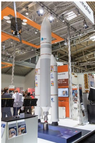
Bild 1: Eye-catcher auf der diesjährigen LASER World of PHOTONICS war das Modell der Ariane 5 Rakete, ein Symbol für die MERLIN Mission. Eine Leihgabe des Deutschen Zentrums für Luft- und Raumfahrt e.V., Köln; beteiligtes Institut: Institut für Raumfahrtantriebe, Lampoldshausen.

Die nächste LASER World of PHOTONICS findet vom 24. bis 27. Juni 2019 statt.